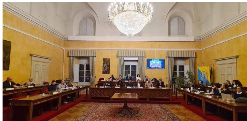
Consiglio comunale di febbraio 2026