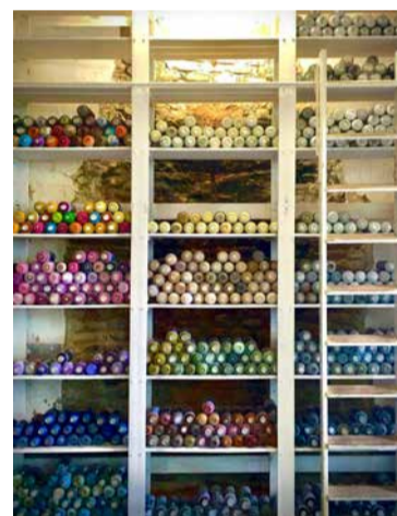
Le bombolette donate da Eron a Labo380

Proprio in occasione della partecipazione al progetto, l'artista ha