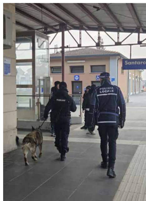
Gli agenti in pattuglia alla stazione FS

I nuovi dispositivi andranno ad aggiungersi alle 18 telecamere di videosorveglianza di cui 4 “targa system”, installate nel 2020 e alle altre 17 telecamere a circuito chiuso installate in altri luoghi pubblici non collegate alla centrale operativa. Tra le misure previste in futuro per il potenziamento della sicurezza c'è anche un ulteriore ampliamento del sistema di videosorveglianza con altre telecamere, a copertura soprattutto del capoluogo, ma anche delle frazioni, comprese sei “targa system” da installare sui principali assi viari della città.