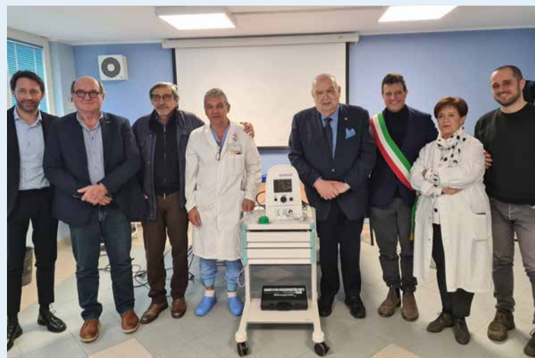
La consegna della strumentazione al reparto di Chirurgia dell'ospedale

Martedì 3 marzo all'ospedale Franchini si è tenuta la cerimonia di conferimento della nuova strumentazione in dotazione al reparto di Chirurgia ad indirizzo Senologico, donata dall'Associazione "Paolo Onofri" con il contributo di Riviera Banca. Ammonta a 12mila euro il costo dell'apparecchiatura con cui è possibile localizzare con precisione i linfonodi sentinella e le piccole lesioni non palpabili nei pazienti oncologici, specialmente nel cancro al seno, usando un metodo magnetico che sostituisce i vecchi traccianti radioattivi o coloranti blu.